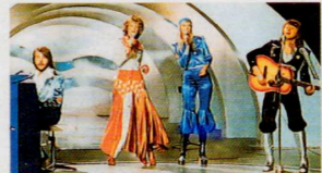
April 1974 Sie kamen, sangen „Waterloo“ und siegten. ABBA beim Grand Prix in englischen Seebad Brighton.